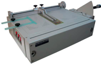
SK530C Creadora de pasta dura

Posicionamiento, Cortador de esquina, Para trabajar el borde de la carpeta eléctrico.