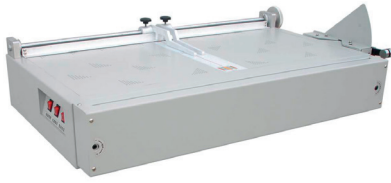
SKJ950C Creadora de pasta dura